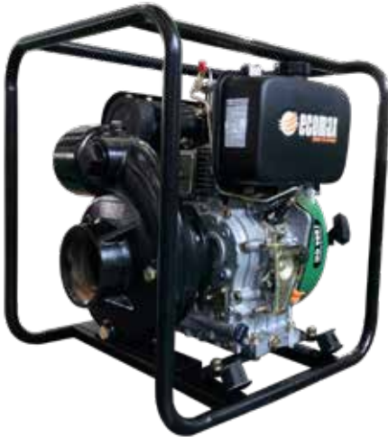
Imagen de referencia, La estructura física puede variar sin afectar los parámetros aquí estipulados

Motobomba de excelente desempeño para labores de transporte de agua en aplicaciones mineras, industriales o agrícolas como abastecimiento de agua, elevación de líquido, riegos o drenajes.